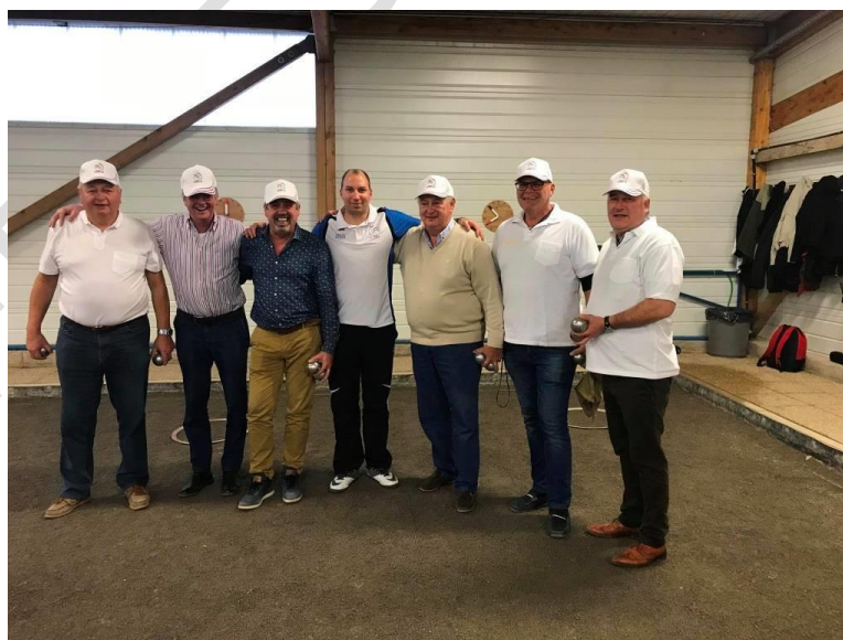
Stage d'apprentissage en présence de joueurs belges et d'un éducateur diplômé FFPJP (nov. 2017)